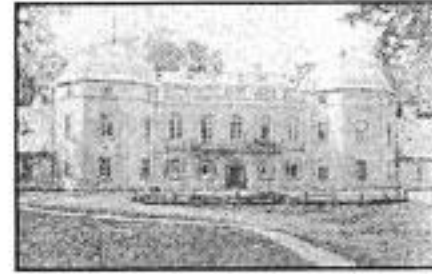
«МЕДИЦИНСКАЯ АКАДЕМИЯ» во времена Жилибера

...Остаток дней Антоний Тызенгауз прожил в уединении, так как был отстранен от дел (некоторые историки утверждают, что причиной тому послужила зависть отдельных вельмож и их козни). Умер реформатор в Варшаве в 1785 (на 52-м году жизни). Однако, несмотря на столь бесславное завершение жизни, Антоний Тызенгауз, бесспорно, внес огромный вклад в развитие Речи Посполитой.